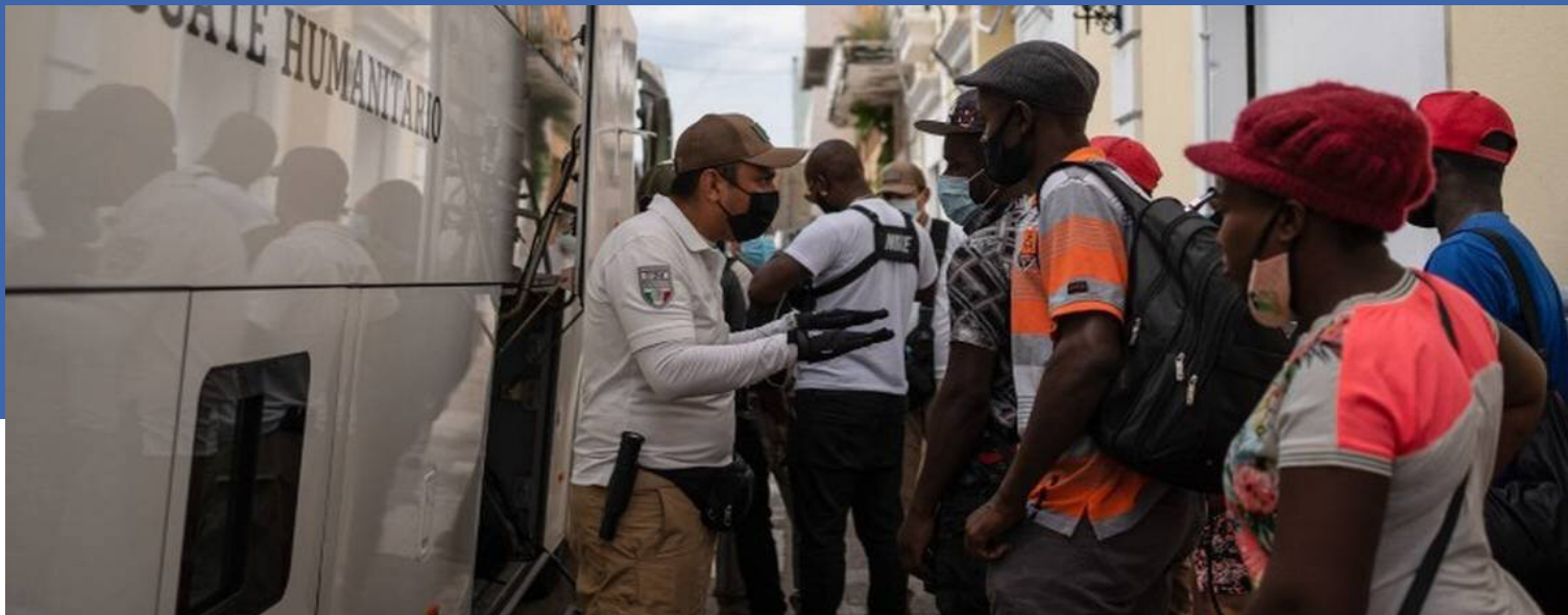
Fotografía Cuarto Oscuro

Por: Jairo Meraz Flores y P. José Juan Cervantes, c.s.