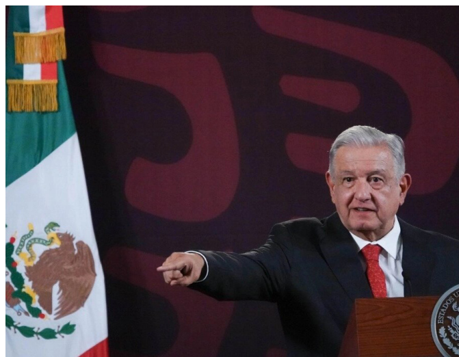
Fotografía de Cuarto Oscuro

problemática que tanto daño y muertes está dejando. Es imposible abrazar a los criminales cuando las manos de las víctimas están ocupadas cargando las pocas pertenencias que pudieron sacar de sus viviendas, cuando los balazos son más constantes y cercanos. Es inadmisibles seguir viviendo bajo este flagelo del que parece imposible escapar. El gobierno tiene la responsabilidad de garantizar la seguridad, tanto de los habitantes de esta región de México como de las personas en situación de movilidad que transitan por ella.