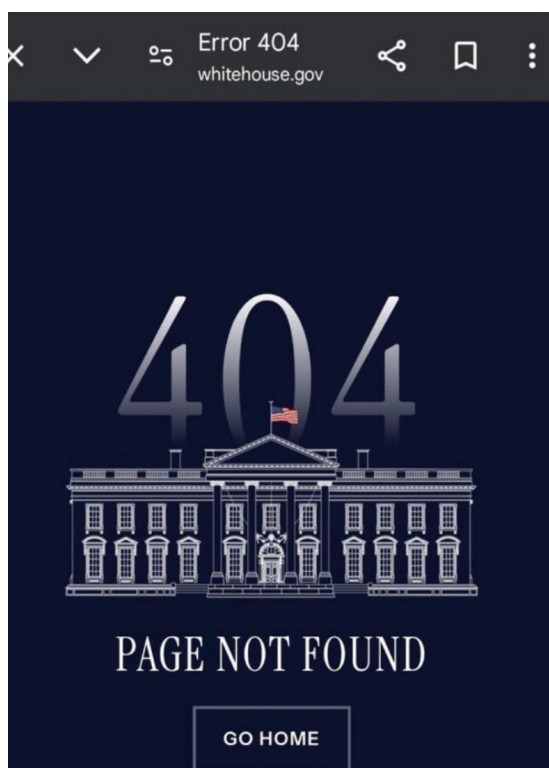
Captura de pantalla de la página oficial de la Casa Blanca

Con sus primeras decisiones gubernamentales, Trump está manifestando que sus promesas de campaña son su plan de acción para “Make